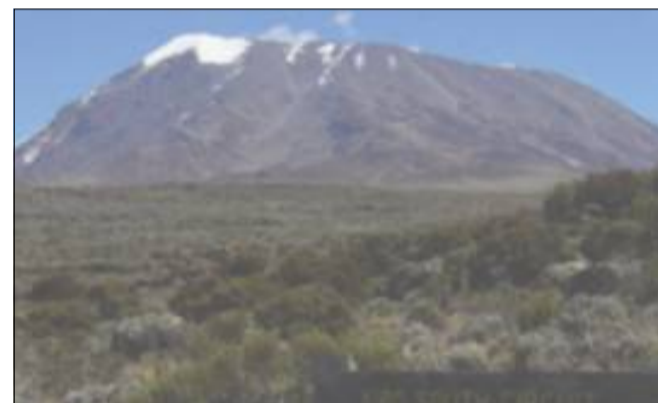
Kilimanjaro rager med sine tre toppe op i næsten seks kilometers højde på den afrikanske savanne. Med sine 5895 meter er det Afrikas højeste bjerg.

- Det er også en motivationsfaktor for, at jeg giver den ekstra skalle til træningen. Jeg forventer, det bliver en megafed oplevelse. Det bliver hårdt, og man skal virkelig støtte hinanden, erklærer hun.